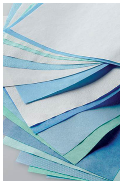
Arjo Wrap™ 160 Soft