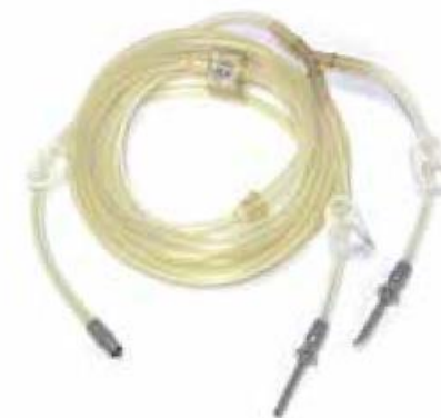
Tube set for Irrigation, reusable, 20 uses (T0506-01)