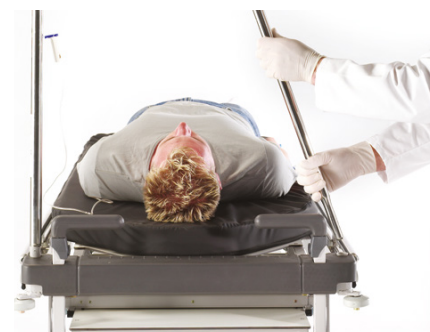
WIESZAK NA KROPLÓWKI