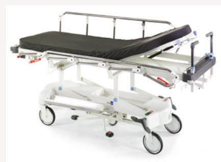
LG 20 w kolorze złamanej bieli

Lifeguard oferuje użytkownikom szeroki wybór różnych funkcji ułatwiających postępowanie z pacjentami w środowisku szpitalnym. Uniwersalny wózek LG 20 posiada jeszcze więcej możliwości dostosowania opcji do indywidualnych potrzeb i budżetu klienta. Opcje do wyboru obejmują podnoszoną platformę na kasetę do RTG oraz system piętego koła Easitrack.