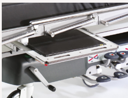
Lifeguard 55: wysuwana kasetka na zdjęcia rentgenowskie

Wózki do przewożenia pacjentów Lifeguard mogą być przystosowane do wykonywania obrazowania na całej długości leża przy użyciu konwencjonalnej kasety rentgenowskiej oraz systemów z ramieniem C. (Uwaga: nie są przeznaczone do rezonansu magnetycznego)