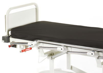
PANEL OPARCIA STÓP