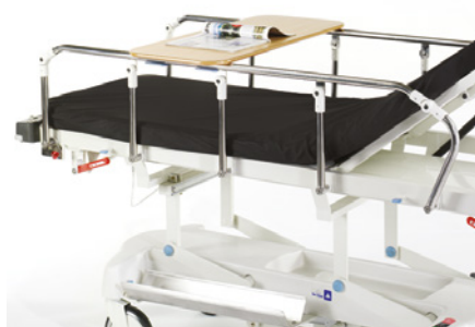
STOLIK MOCOWANY NA ZATRZASKI