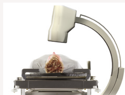
Lifeguard 55: kompatybilny z ramieniem C na całej długości leża