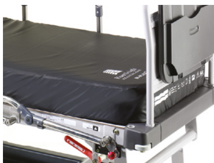
PÓŁKA NA MONITOR/UCHWYT NA NOTATKI