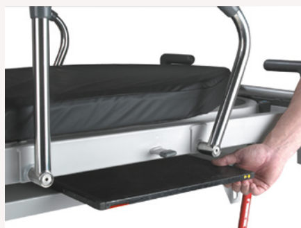
Lifeguard 50 i 20: podnoszona platforma na kasetę RTG na całej długości leża