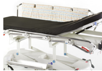
OSŁONY BARIEREK ZABEZPIEZAJĄCYCH