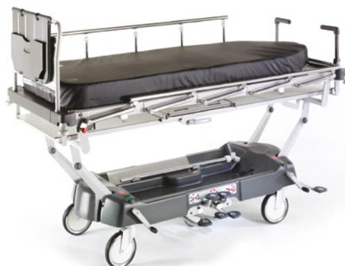
Materac Bi-Flex pokazany na wózku LG 55