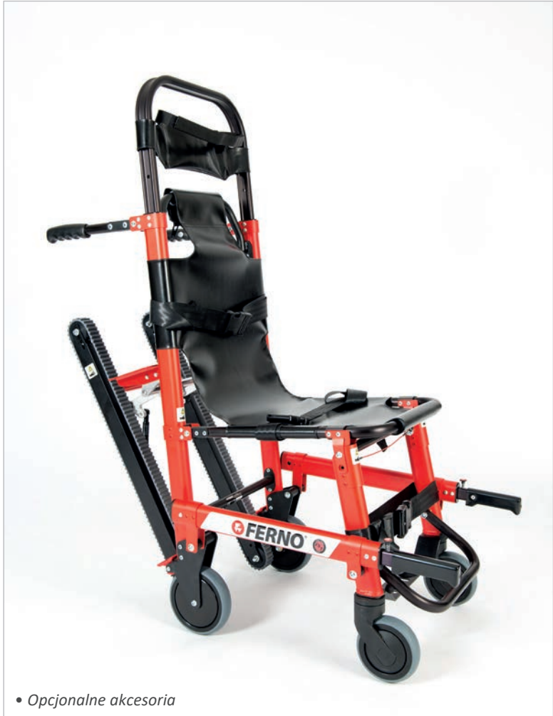
• Opcjonalne akcesoria