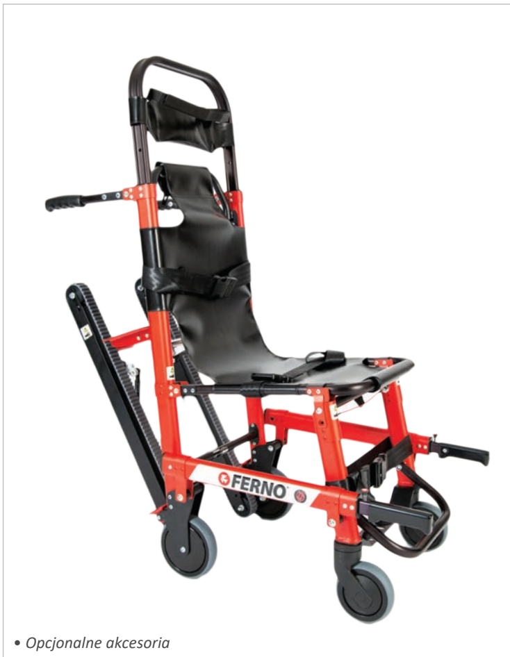
• Opcjonalne akcesoria