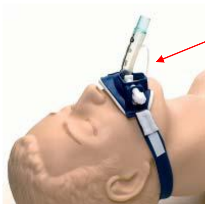
uchwyt dla dorosłych