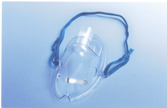
Maska tlenowa, dla dorosłych