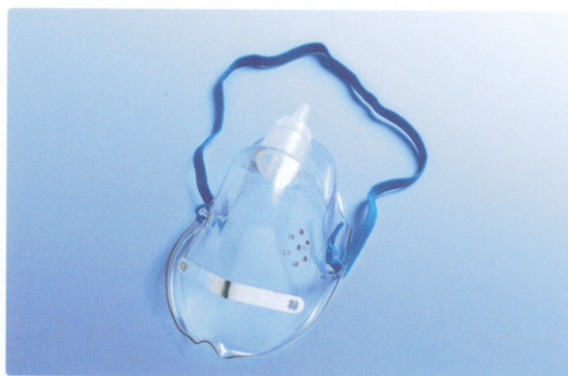
Maska tlenowa, dla dorosłych, przylegające pod brodę, bez drenu