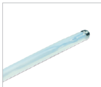
Atraumatyczna końcówka bezpieczna dla kanału roboczego endoskopu oraz błon śluzowych pacjenta