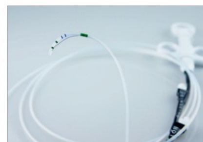
Papillotom z uchwytami