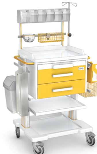
OZ-2ABSb z wyposażeniem