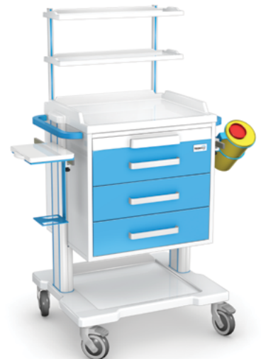
OZ-3ABSb z wyposażeniem