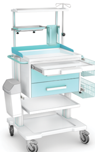
OZ-2STb z wyposażeniem