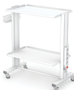
MOD-1 z listwą zasilającą i koszykiem