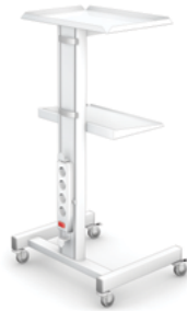
ECO-2 z listwą zasilającą