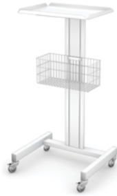
ECO-1 z koszykiem