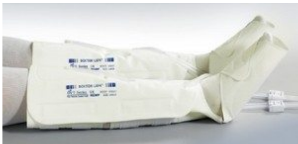
Mankiet typu "but" 3 komory powietrzne