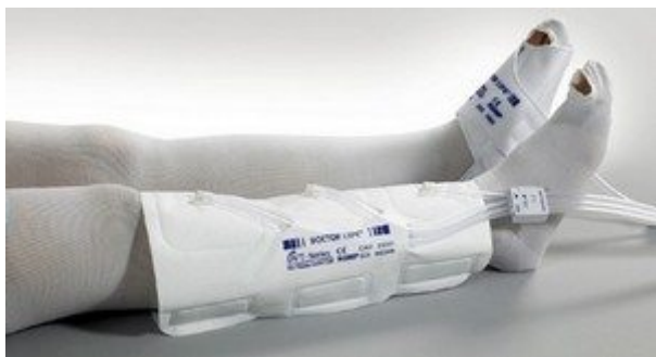
Mankiet na łydkę i stopę (jednoczesne zastosowanie 2 różnych mankietów)