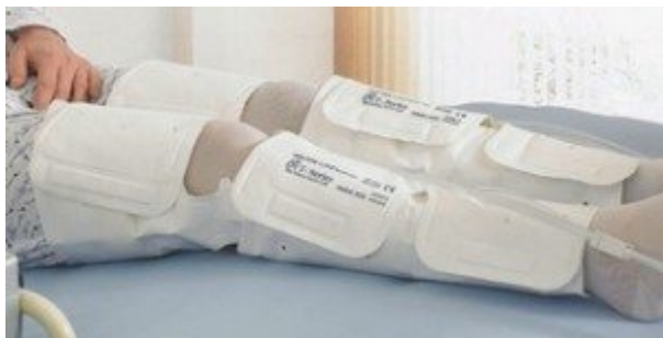
Mankiet na udo i podudzie 3 komory powietrzne