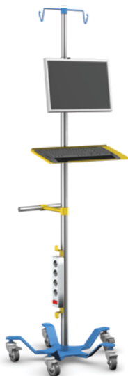
SM-06 z dodatkowym wyposażeniem