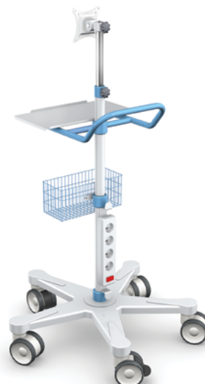
Opcja: EM-01/ABS z uchwytem na monitor

Z podstawą z tworzywa ABS Średnica podstawy: 730 mm