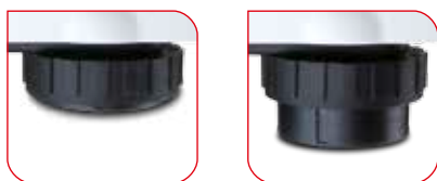
Nóżki poziomujące umieszczone pod platformą wagi zapewniają stabilność na każdym podłożu.

seca 899 wyposażona jest we wszystkie funkcje do częstego użytku: funkcja BMI pomaga w określeniu stanu odżywienia, funkcja HOLD pozwala na zatrzymanie wyniku pomiaru na wyświetlaczu, a funkcja TARA wytarowuje np. masę ciała dzieci trzymanyh na rękach dorosłych. Odczyt wyników jest niezwykle wygodny dzięki możliwości dowolnego ustawienia kąta nachylenia panela z wyświetlaczem.