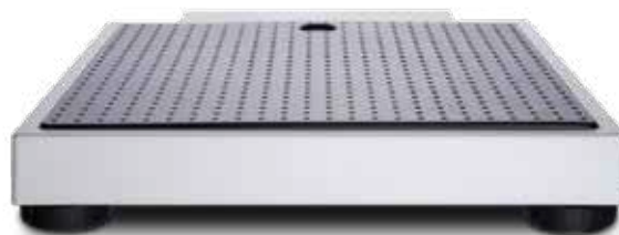
Kompaktowe wymiary i niewielka waga własna umożliwiają wygodny transport i mobilne zastosowanie.