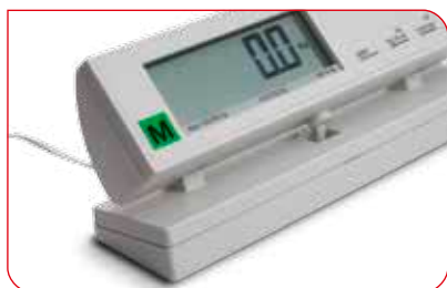
Wyświetlacz można ustawić pod kątem dogodnym do odczytu i korzystać z niego z dala od wyświetlacza.