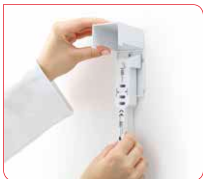
Łatwe uzupełnienie o maksymalnie 100 miarek.

seca 211 jest dostępna, kiedy tylko jej potrzeba. Sto miarek mieści się w tym małym ściennym dozowniku, który wydaje po jednej sztuce. Dozownik może być w łatwy sposób zamontowany w dowolnym miejscu. Jego uzupełnienie jest prostym zadaniem.