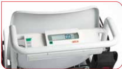
Ergonomicznie uformowany uchwyt pozwala na pchanie lub ciągnięcie wagi w dowolnym kierunku.

Waga seca 959 wyposażona jest w cztery zwrotne i łatwo poruszające się kółka, które umożliwiają zastosowanie nawet w najciaśniejszych pomieszczeniach.