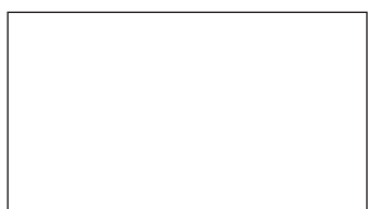
140 x 190 cm