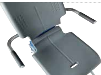
Podłokietniki z szerszym rozstawem Standardowa szerokość 44 cm, zwiększona do 54 cm Nr. Art. 945 146