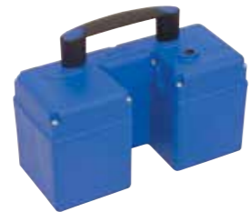
Dodatkowa bateria BU PT 5,2 Ah waga 4.3 kg, pojemność 5.2 Ah, moc 24 VDC Nr. Art. 004 150