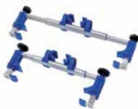
Klamra podpięcia wózka do PT Uni Szeroka: 360-560 mm, Nr. Art. 945 131 Wąska: 270-380 mm, Nr. Art. 945 114