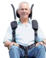
Gama pasów bezpieczeństwa 5-punktowy pas, Nr. Art. 945 144 / Pas biodrowy, Nr. Art. 945 118 / Biodrowo/klatkowy pas, Nr. Art. 945 158