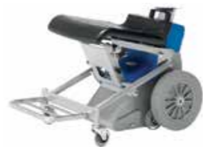
Składany podnóżek Nr. Art. 945 157