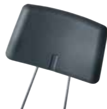
Regulowany zagłówek Nr. Art. 947 013