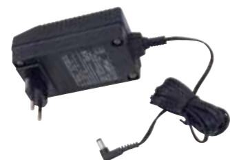
Ladowarka BC-PT z eurołączem Nr. Art. 045 141

Akcesoria do schodolazów LIFTKAR PT są specjalnie zaprojektowane w celu zaspokojenia indywidualnych potrzeb i wymagań osób z trudnościami w chodzeniu. Jakość rozwiązań technicznych i konstrukcja to sprawa najwyższej wagi.