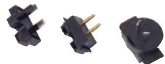
Adaptory wtyczek Wielka Brytania, Nr. Art. 045 142 / USA, Nr. Art. 045 143 Australia, Nr. Art. 045 144