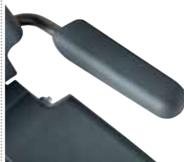
Podłokietniki z miękką tapicerką Nr. Art. 945 148