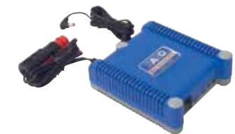
Przenośna ładowarka BC 10-30 VDC-PT Nr. Art. 945 120