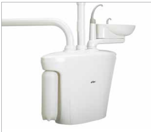
Butelka do zamkniętego obiegu wody.

Porcelanowa miska spluwaczki obraca się do położenia najdogodniejszego dla pacjenta. Łatwa do napełniania, 2-litrowa butelka zapewnia dopływ wody w trakcie wielu zabiegów. Pojemny blok spluwaczki może pomieścić dodatkowe podzespoły, takie jak separator amalgamatu i separator pompy ssącej.