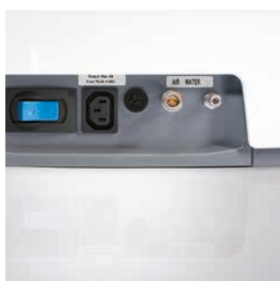
Zestaw zaworów do urządzeń zewnętrznych