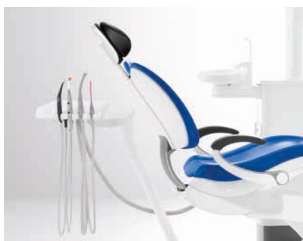
Konsola asysty Comfort

Obie konsoly asysty gwarantują oszczędność miejsca i znaczną swobodę ruchu. Model Comfort dodatkowo umożliwia pracę na dwie ręce.