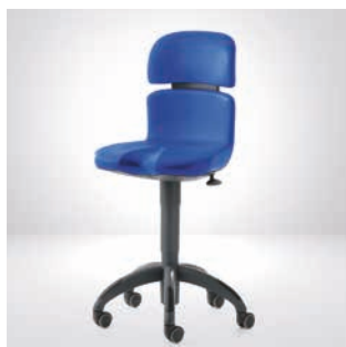
Stołek roboczy Hugo