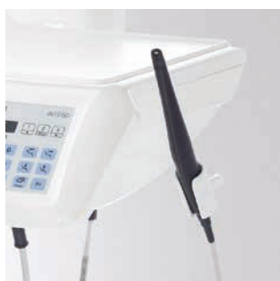
Dodatkowy uchwyt kamery dla wersji TS