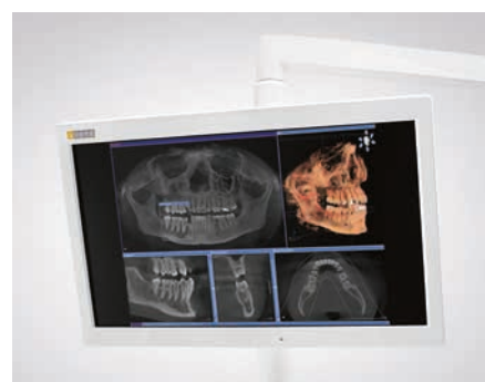
Monitor Sivision 22" AC

Na monitorze można wyświetlić obrazy z kamery wewnątrzustnej, obrazy RTG, programy, efekty planowania stomatologicznego, materiały wideo i prezentacje PowerPoint – wszystko bezpośrednio na unicie stomatologicznym.