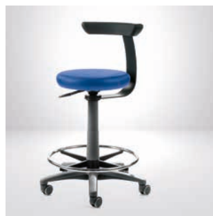
Stołek roboczy Paul (z dodatkowym kręgiem na stopę)