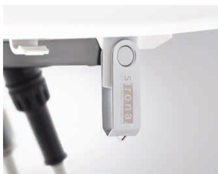
Wbudowane złącze USB

Złącze USB w konsoli lekarza lub asysty umożliwia integrację dodatkowych funkcji. Możliwość podłączenia unitu do sieci ułatwia pracę serwisanta.