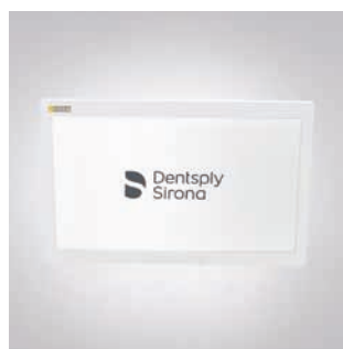
Monitor 22" AC