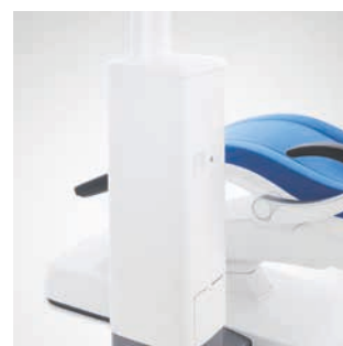
Intego bez spluwaczki