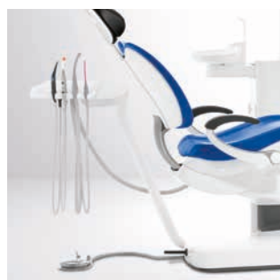
Mocowanie dla Heliodent Plus