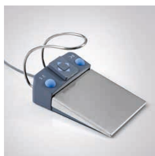
Elektryczny sterownik nożny C+