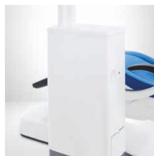
Intego Pro bez spluwaczki