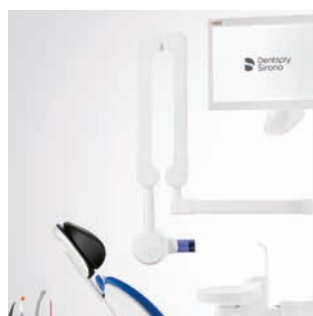
Mocowanie dla Heliodent Plus