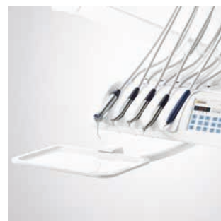
Dodatkowa tacka dla wersji CS