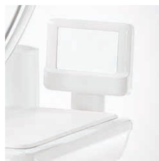
Negatoskop dla RTG wewnątrzustnych