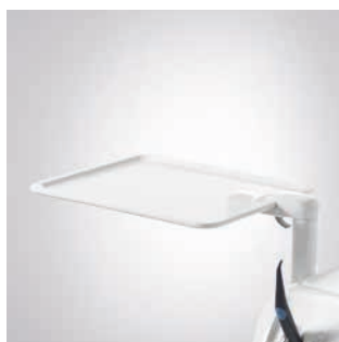
Dodatkowa tacka dla wersji TS