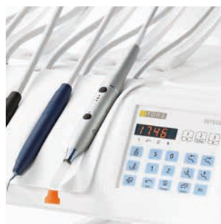
Lampa do polimeryzacji Satelec Mini LED