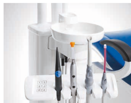
Konsola asysty Compact