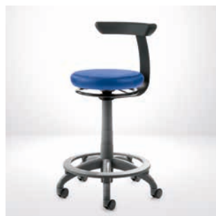
Stołek roboczy Carl