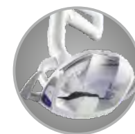
Lampa LED DCI-6