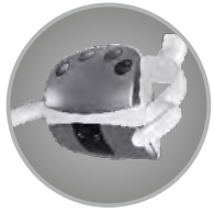
Lampa LED D4-2