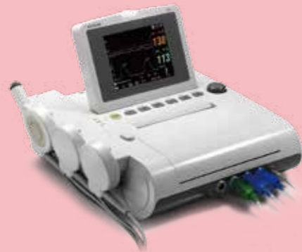
F3 Monitor Płodu