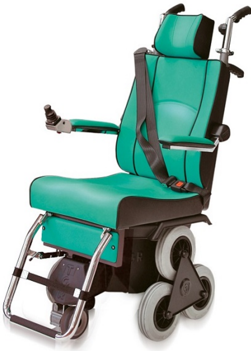
TOLLO 120 ELECTRIC