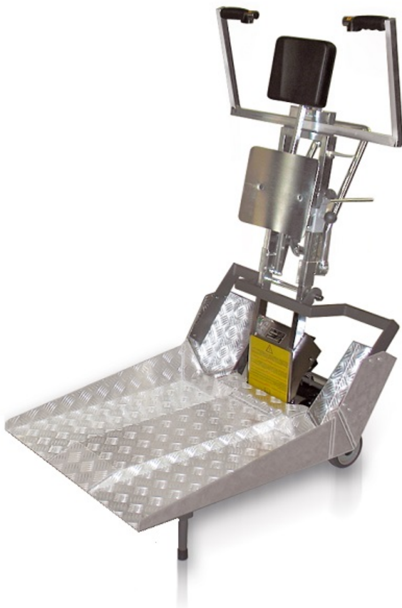
JOLLY 150 MINI RAMPY