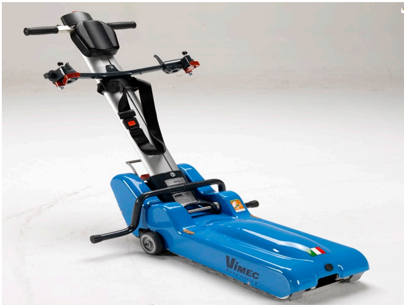
VIMEC T09 ROBY