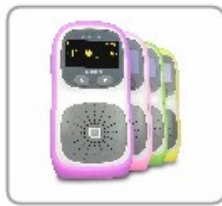
kolorowe gumowe osłony