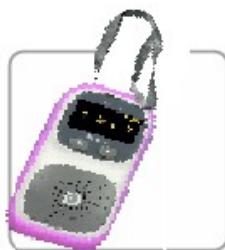
pasek do łatwego przenoszenia