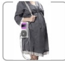
badanie można zakończyć na zewnątrz pokoju