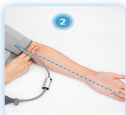
Założ mankiety na ramię