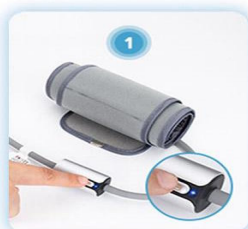
Włącz urządzenie i otwórz aplikację AirBP