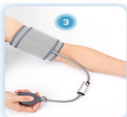
Kliknij start na aplikacji i pompuj gruszkę