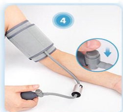
Po zakończeniu pomiaru wypuść powietrze