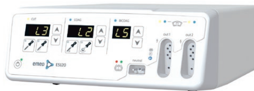
100-015 Aparat elektrochirurgiczny ES 120