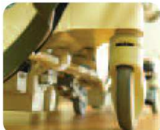
Nowej generacji system sterowania Steering Plus™