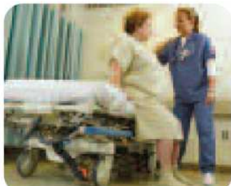
Niska pozycja wejściowa/zejściowa ułatwiająca bezpieczne wchodzenie i schodzenie z wózka