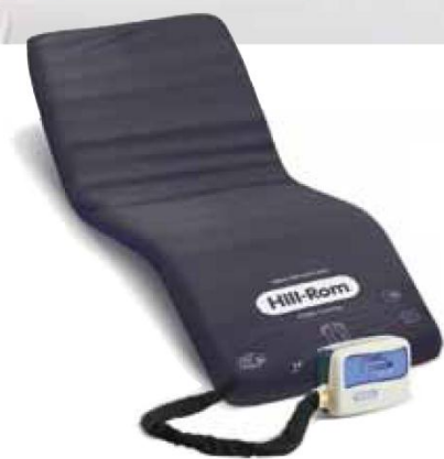
Aktywna powietrzna nakładka na materac Hill-Rom P280