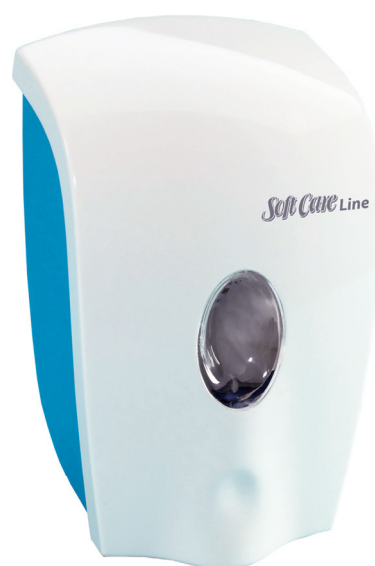
Dozownik Soft Care Line

Dzięki używaniu dozowników Soft Care Line oszczędzacie Państwo czas, a także nakład pracy jaki muszą wykonać pracownicy. Specjalne wkłady z mydłami - 800 ml - są łatwo wymienialne. Sam dozownik jest prosty w zainstalowaniu. Na jego powierzchni nie znajdują się żadne zagłębienia i nierówności, które pozwalałyby na gromadzenie się brudu i kurzu. Dzięki zamontowaniu w dozowniku specjalnego okienka, możliwe jest również monitorowanie poziomu zużycia preparatu.