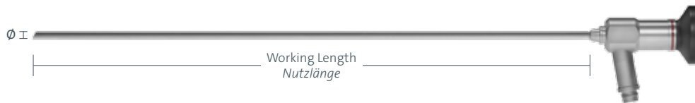
Scale: 1:3 Maßstab: 1:3

These endoscopes are used in urology. In urethrocytscopy, an endoscopy of the bladder and also of the urethra in males is carried out using the cystoscope.