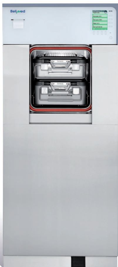
Sterylizator parowy VAPOFIX z drzwiami automatycznymi