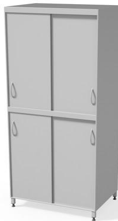
szafa lekarska WM3115