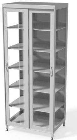
szafa lekarska WM3114