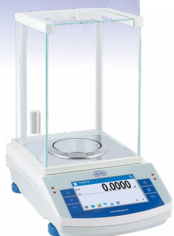
AS X2 Wagi analityczne

Nowa seria wag laboratoryjnych RADWAG 2015