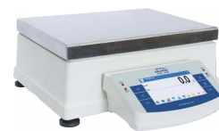
APP X2 Wagi precyzyjne