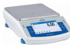
PS 10 X2 Wagi precyzyjne