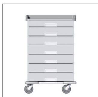
MEDICART 1000 WITH 1 DRAWER OF 5 CM AND 6 DRAWERS OF 10 CM MEDICART 1000 1 SZUFLADA 5 CM, 6 SZUFLAD 10 CM