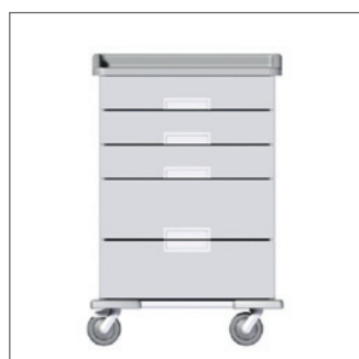
MEDICART 1000 WITH 3 DRAWERS OF 10 CM AND 2 DRAWERS OF 20 CM MEDICART 1000 3 SZUFLADY 10 CM, 2 SZUFLADY 20 CM