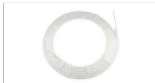
Poręczny dispenser prowadnika