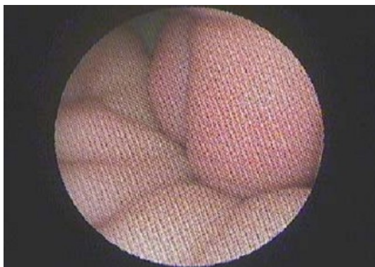
Obraz bez filtra anti-moiree

systemie Full HD, posiada 3 przetworniki 1/3" CCD. Rozdzielczość 1920 x 1080 (1080 Full HD Format). Adapter TV f = 18 - 50 mm o powiększeniu 2,7x, kompatybilny ze standardowymi optykami endoskopowymi. Filtr anaty moiree poprawia współpracę z endoskopami elastycznymi. Głowica kamery przeznaczona jest do sterylizacji w płynach, nadaje się do dezynfekcji, kompatybilna ze Steris i Sterad S100. Klasa bezpieczeństwa BF. Kamera posiada oznaczenie CE zgodnie dyrektywą medyczna 93/42/EWG i kompatybilność elektromagnetyczną z wymaganiami EN 60601-1