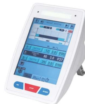
Dwa ekrany dotykowe (pomieszczenie pacjenta i pomieszczenie sterowania)