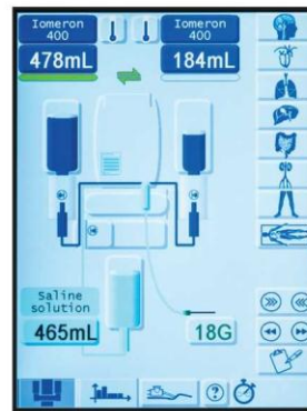
Panel główny wstrzykiwacza