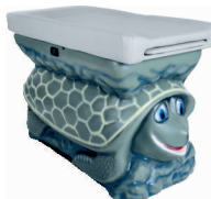
Model ŻÓŁW Nr. Art. 4900