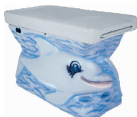
Model DELFIN Nr. Art. 4800