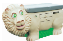
Model LEW Waga: 68 kg Wymiary: 89 x 100 x 180 cm Wysokość leżanki: 83 cm Nr. Art. 4500DT