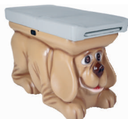
Model PIES Nr. Art. 4700

W porównaniu do model BASIC, stoły COMPACT nie są wyposażone w szuflady.