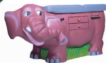
Model SŁON Waga: 68 kg Wymiary: 86 x 94 x 175 cm Wysokość leżanki: 83 cm Nr. Art. 4400DT