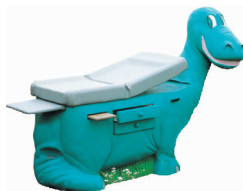
Model DINOZAURO Waga: 68 kg Wymiary: 81 x 150 x 200 cm Wysokość leżanki: 83 cm Nr. Art. 4300DT