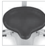
Siedzisko w kształcie siodła