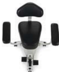
Siedzisko w kształcie klina