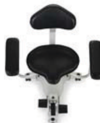
Siedzisko w kształcie siodła (opcja)