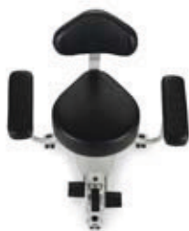
Siedzisko w kształcie łży

Możliwość doboru konfiguracji krzesła zgodnie z własnymi preferencjami i pełna regulacja oparcia i podłokietników gwarantują użytkownikowi maksymalny komfort i optymalną pozycję podczas pracy. Doskonały dostęp do sterowania i stabilna, ale i mobilna konstrukcja plasują to krzesło w gronie najlepszych rozwiązań dla szpitali i chirurgów.