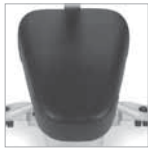
Siedzisko w kształcie klina