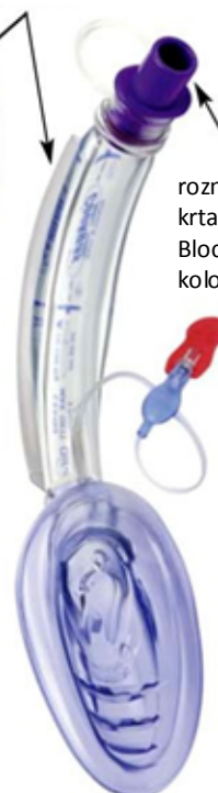
jednorazowa air-Q Blocker 4,5