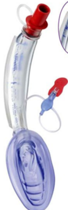
jednorazowa air-Q Blocker 3,5