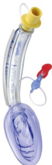
jednorazowa air-Q Blocker 2,5