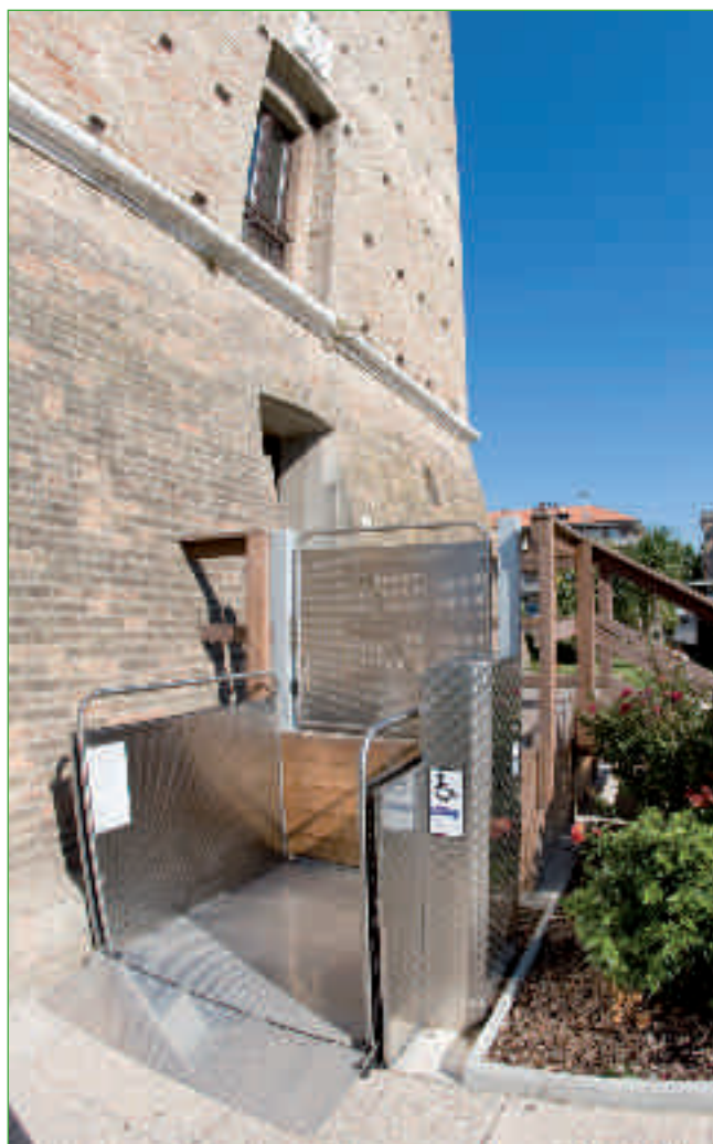
Wersja z wejściem na wprost

Elektryczne urządzenia ryglujące zapewniają automatyczne otwieranie bramki, kiedy platforma dojedzie na wybraną kondygnację.