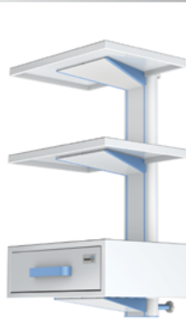
widok z dołu

Przykładowe rozwiązania zestawu półkowego montowanego na szynie instrumentalnej