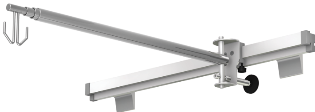
KO-2m z uchwytem na szynę instrumentalną USU-01