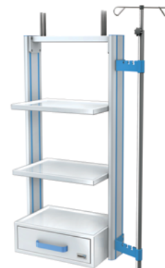
DSU-03 Zestaw półkowy mocowany na stałe do jednostki zasilającej sufitowej