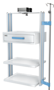
DSU-01 Zestaw półkowy z mechanizmem przesunym

Przykładowe rozwiązanie zestawów półkowych montowanych do jednostki zasilającej sufitowej z mechanizmem przesunym