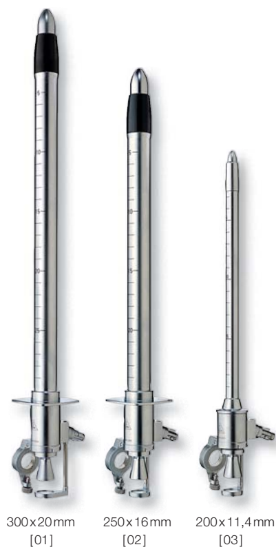
300x20 mm [01]