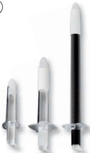
85x20mm 130x20mm 250x20mm